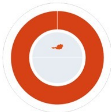
Herkunft der Nachweise

63,59 % Wasserkraft 32,00 % Sonnenenergie 4,41 % Sonstige erneuerbare Energieträger